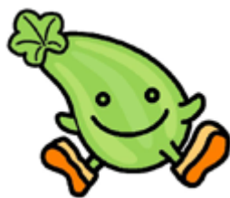
東成区キャラクター 「うりちゃん」